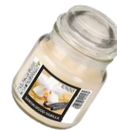
Duftkerzen Im Glas